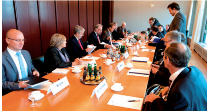
Die Mitglieder der Steuerungsgruppe vor Gesprächsbeginn

Als Nachteilsausgleich für das Nichtvorhandensein einer Entgeltordnung einigten sich dbb tarifunion, VKA und Bund, wie im Jahr 2010 auch, auf eine Pauschalgleichzahlung in Höhe von 250 Euro für das Jahr 2011. Ausgezahlt werden soll dieser Betrag bis Ende Oktober 2011. Vorbehaltlich der Redaktion gilt dies für ab 1. Oktober 2005 neu eingestellte Beschäftigte der EG 2 bis EG 8 und auf Antrag für übergeleitete „Wechsler“, denen nach dem 30. September 2005 Tätigkeiten übertragen wurden, die zu einem neuen Eingruppierungsvorgang geführt haben. Von der Zahlung ausgenommen sind Beschäftigte, die unter die KR-Anwendungstabelle fallen, die ehemalige Statusgruppe der Arbeiter, Beschäftigte im Sozial- und Erziehungsdienst und im Nahverkehr.