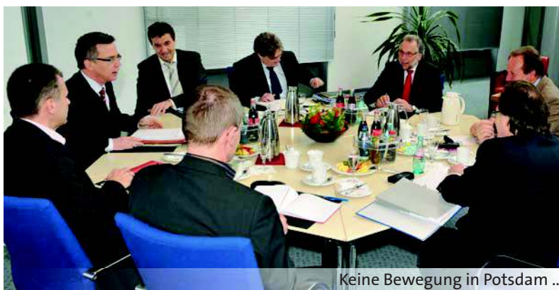
Keine Bewegung in Potsdam ...